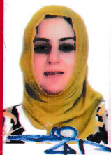
سه روکی زانکۆ