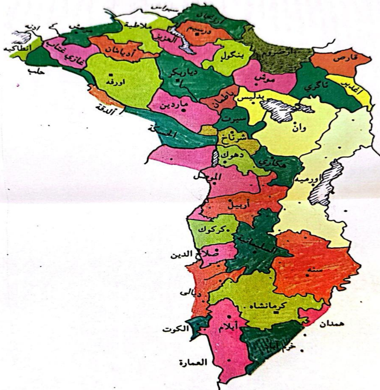
الخارطة رقم «٦»