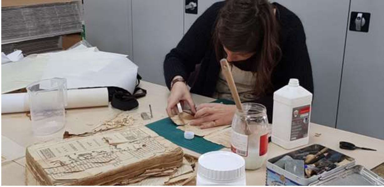
وینەى ژمارە (۴) چاککردنەوہى دەستنووس(سەردانى مەيدانى)