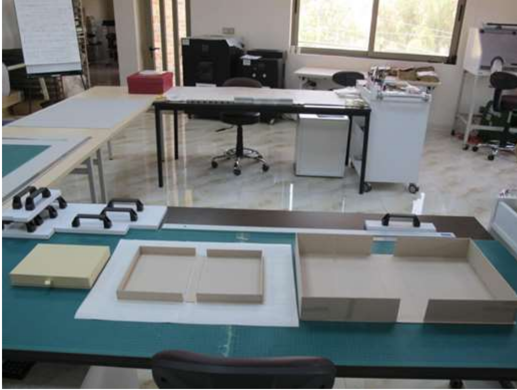
وینہی ژماره (7) هه لگرتنی دهستنوس (سهردانی مهیدانی)

له کۆتاییدا هه لگرتنی هه ریه کیک له و سندوقانهی که دهستنوسه کهی تیدا پاریزراوه له سه ر هه فیه که له ئاسنی روپوشکراو به مادهیه کی دژه ژهنگ هه لهیناندا. له ژووریک که سه رجه م مه رجه کانی پاراستنی تیدا په چا وکراوه.