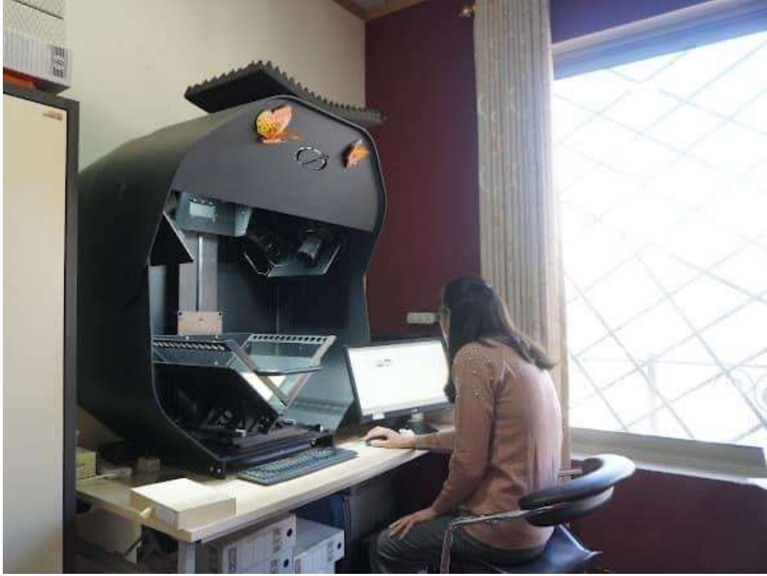
وېنەى ژمارە (6) وېنەگرتنى تەواوى دەستىنوسەكە (سەردانى مەيدانى)

قۇناغى پىنچەم و كۇتايى: برىتتە ئە قۇناغى ھەلگرتنى دەستىنوسەكە، بۇ ھەر دەستىنوسىك سىندۇقتىكى تايىبەت دروست دەكرىت بەبەكارھىنانى جۇرىكى تايىبەت ئە مقەوا كە دژە ئۇكسان و دژە ترشانە بۇ پاراستنى دەستىنوسەكە ئەھەر ئەگەرىكى ئەناوچوون.