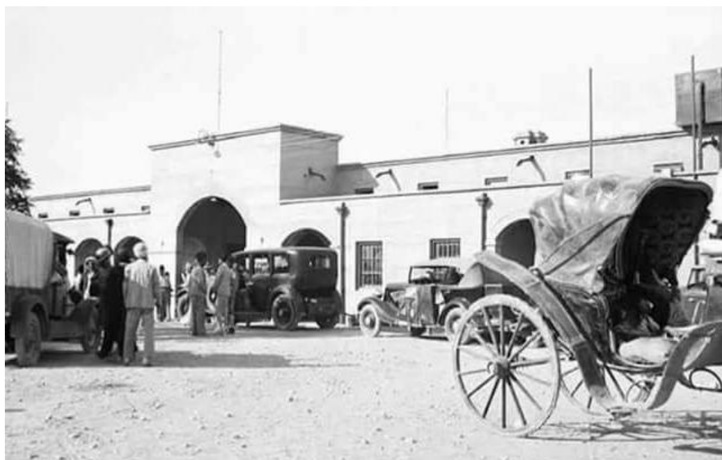
وینسگی شه‌مهنده‌فهری کهرکوک سائی (۱۹۴۰)