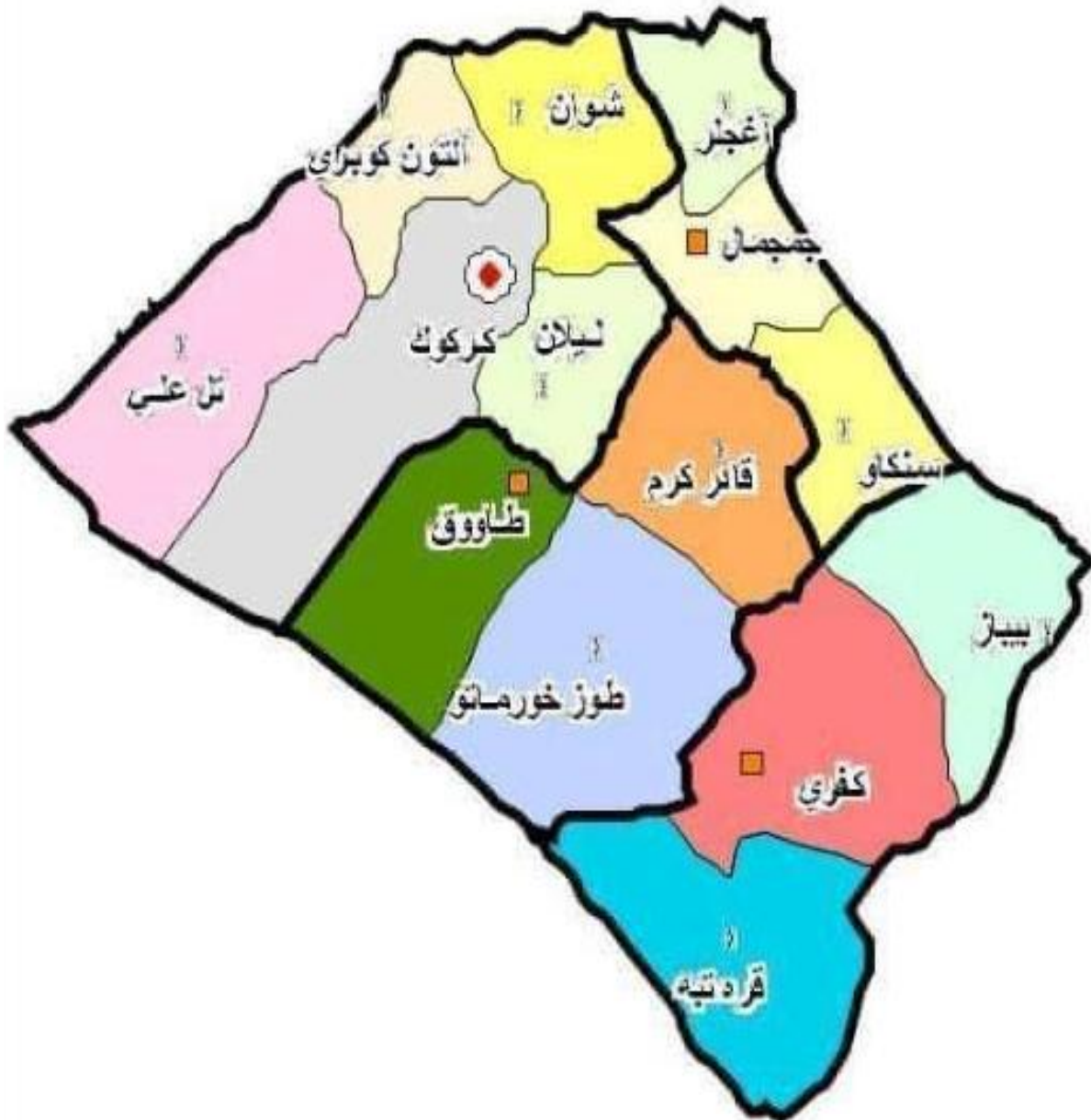
نیوای کهرکووک سائی (۱۹۳۶)