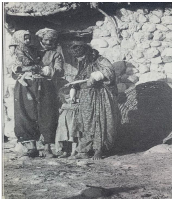
خیزانیکی کوردی جوو