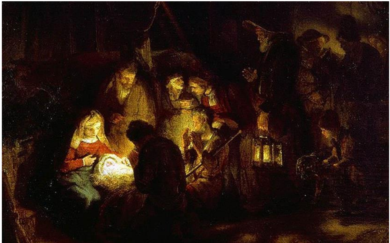
( شيوه 7 ) تابلوی رامبرانت ۱۶۶۸ رازاندنوهی شوانهکان

7 _ یاسای گونجان : سهرهراي جياوازييه بهرچاوهکاني نيوان پيکهاتهکاني تابلوکه له شيوهکان و رهنگهکان ، پيوسته دابهشکردنهکاني مهليکي روون بو کوبونهوهي ريکخراو نيشان بدن