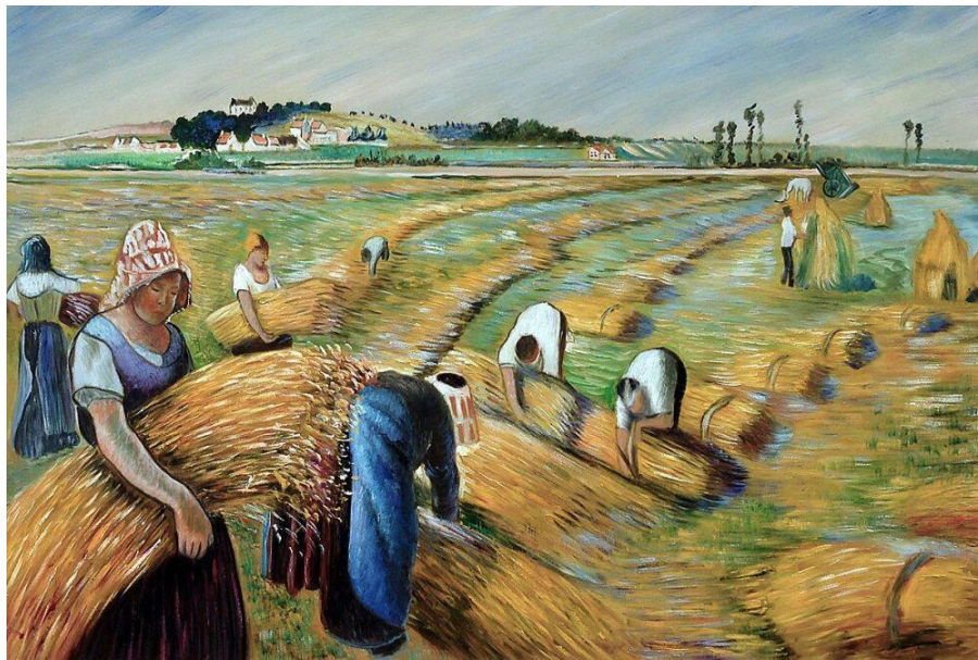
( شيوه 6 ) تابلۆى بيسارۆ دروينه‌وه ۱۸۸۲

3 _ ياساى به‌رده‌وام بوون : به پئيدانى چه‌ند زنجيره‌يه‌ک و به‌رده‌وام بوونى رىکخراوانه‌ى ژماره‌يه‌ک لهو شتانه ئه‌نجام ده‌درئيت که زياتر يان که‌متر له‌يه‌ک ده‌چن و ئه‌م زنجيره‌يه زياتر سه‌رنج راکئيشه کاتئىک په‌يوه‌ندى به هه‌ندىک گۆرانکارى به‌ره به‌ره له سروشتى بابته‌که‌دا هه‌يه يان به‌شئىکى له‌سه‌رى .