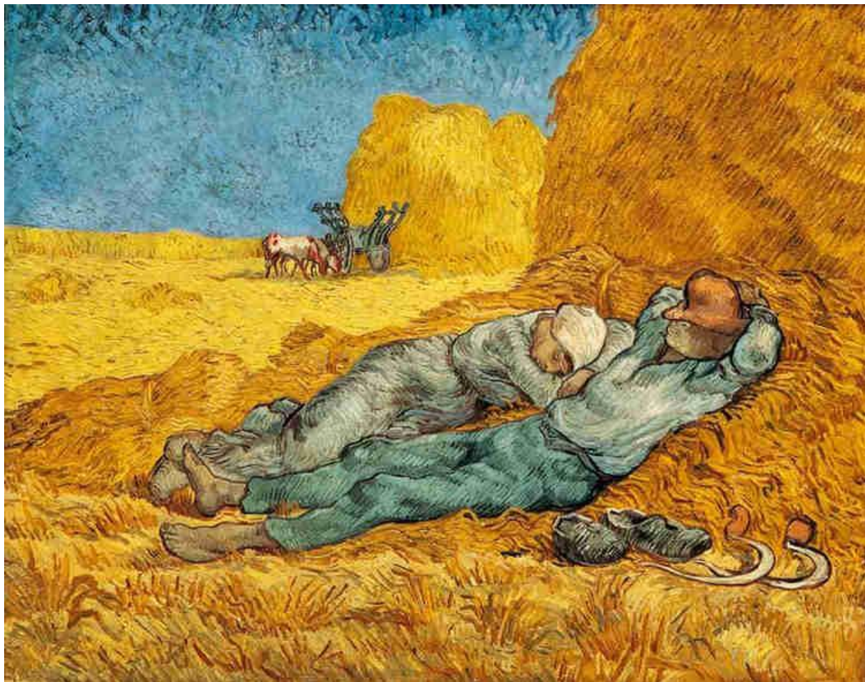
( شیوه 5 ) تابلوی فانکوخ ۱۸۹۰ پشوی نیوهرۆ له کار

قسهکردن لهسهر چهمکی بنیاتنان له پیکهاتهی هاوچهر خدا دهبیت به جۆرهکانی پیکهاتهدا تپهر بیت که بتوانین بچینه ناو میکانیزمی دابهشکردنی شیوهکان لهناو پیکهاتهی تهکنیکیدا و ئەم جۆرهیان له راستیدا بنهما یان یاسای دابینکردن زیاتر له سهربهخۆ یان جیا و گرنگترین یاسا فۆرماتییهکان که رسکن ئاماژهی پیکرد .