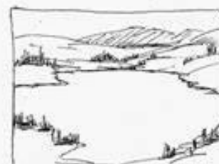
"O" or Circular