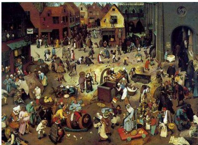
( شیوه 8 ) تابلوی بیتر بروگل ۱۵۵۹ کهرنهقال

1 - پیکهاتهکانی بلاوبونهوه : که تئیدا یهکهکان به شیوهیهکی هاوړهگمز و ریک و پیک دابهش دهکړین بهی ناوهندی تیشکدانهوه یان خالیکی تهکیز یان دووپاتکردنهوه، وهک له کاری بیرگیل بوش.