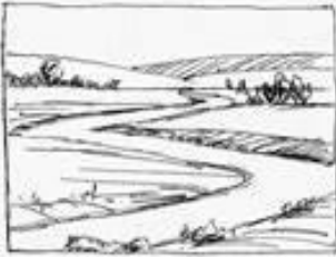
"S" or Compound Curve.