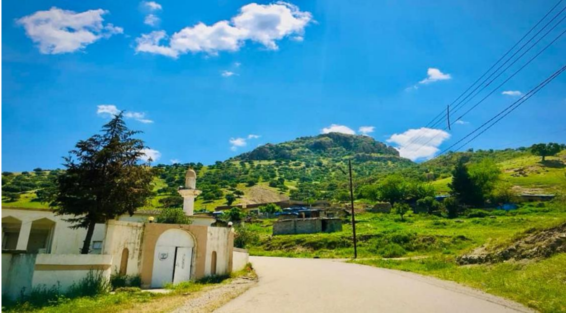
وینہی ژماره (۴)