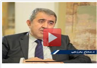
4 ماف و نازادیهکان له نیسلامدا دسهباح بهرزنجی...

سهرمشقی بزاف و رهوتی رۆشنهزری له کوردستان؟، بۆ نهیتوانی کۆمهله قوتابیهک لهسهر ههمان ریباز پهروهده بکات بۆ بهردهوامیدان بهم ناراسته هزرهیه؟، رینگهکانی بهردهم پرۆژه نیسلاحیهکه له کوردستان چی بوون؟، نایا بیر و هزر و بهرهمهکانی شیخی خال کاریگهری ههقیقیان لهسهر ناوهنده ناینبیهکانی کوردستان ههسووه یاخود نا؟، پرۆژهی نوێخوازی و ریفۆرمی ناینبی تا چهند وهک بیۆستیهیکی ناینبی و کۆمهلایهتی له کوردستان سهبرکراوه؟ نهامانه گرنگترین نهو پهرسیارانهن که له پیناو وهلامهکانیان نهم دیدارانه و دواتر چاپکردنیان له دووتویی پهرتووکهکه به پایان گهیشتوو.