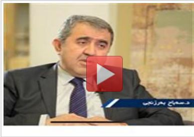
• ماف و نازادیهکان له نیسلامدا دسهباح بهرزنجی...

نهم بهشه بهسەر چهاند لقیك دابهشكراوه، له لقی نهلیف پیناسهی مهعریفه و زانست له رووی زمانهوانییهوه كراوه و له كۆتایی نووسەر گهیشتووه بهو نهجمهیهی كه ههر دوو چهكمی (مهعریفه و زانست) له رووی زمانهوانی زمانی عهرهیی هاوواتان، چونكه ههر دووكیان گوزارشت له دنیایی و نۆقرهی دهروونی زانیار بهرامبهر شته زانراوهكان دهكهن.