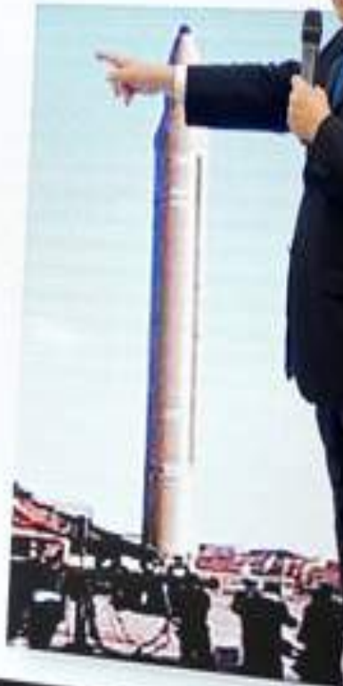
Ghadr 1H 1,650 km