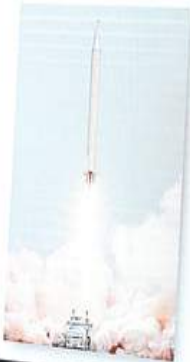
Shahab 3 1,000 km