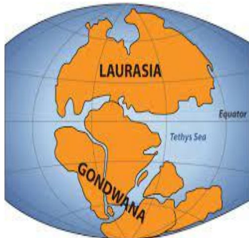
TRIASSIC 200 million years ago

ئەمریکا باشور بەشیکیە لە کوتلەیی کۆن کە لە لایەن جیولوجیەکان ناسراوە بە کیشوہری گۆندوانالاند ، کە پیک دیت لە ئوسترالیا و مەدەغشقر، نیچە دوورگەیی دکن ، ئەفریقا و ئەمریکای باشور و ئەنتارکتیکا.